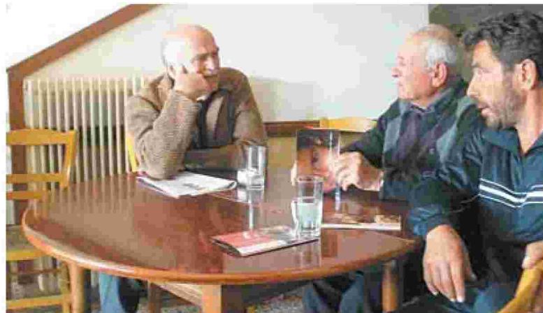
Στο χωριό Αυλή. Στη διάρκεια του Καφενείου Αντρών, οι κάτοικοι είχαν την ευκαιρία να συζητήσουν με τον καθηγητή Γιάννη Παλλήκαρη (αριστερά) και εθελοντές του Πανεπιστημίου των Ορέων για προβλήματα που τους απασχολούν